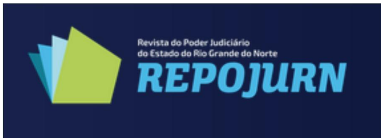
Figura 1: Título da figura (tamanho da fonte: 12)

Fonte: [fonte dos dados ex: o(s) autor(es), pesquisa de campo] (tamanho da fonte: 11)